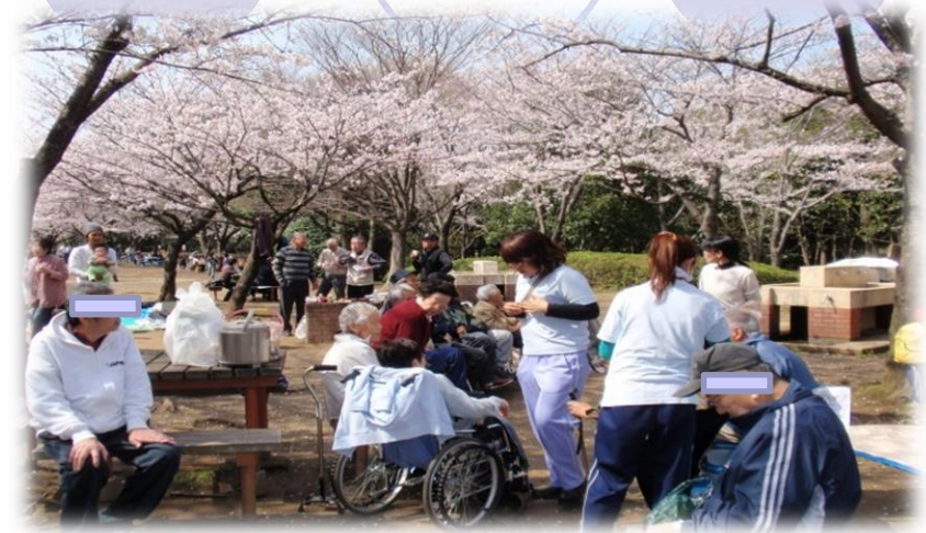
家族も一緒にお花見