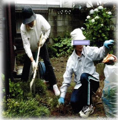
地域の助け合い活動