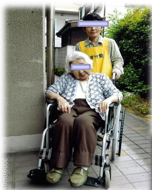
ボランティアさんの散歩