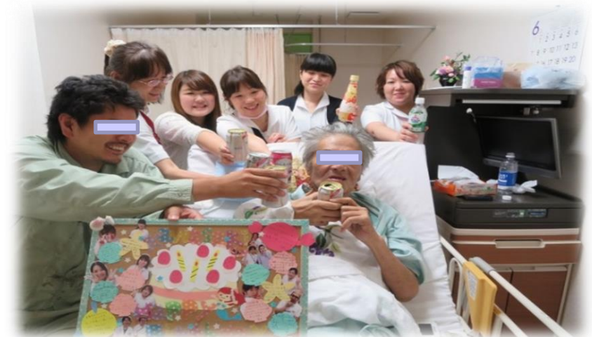
ノンアルコールで誕生日会