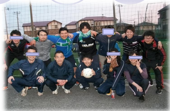
リハビリ職員の皆さん