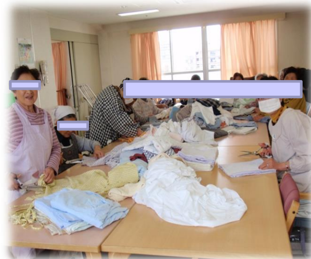
清拭布づくりの様子