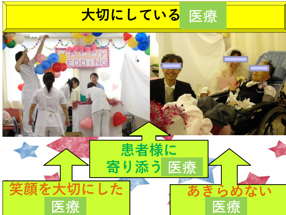
リハビリ室で結婚式