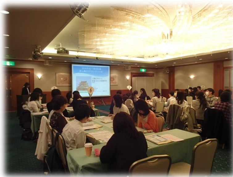
制度研修で学び合い